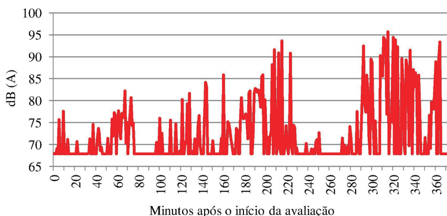
GRÁFICO 2 - Leituras realizadas pelo dosímetro, no segundo dia.