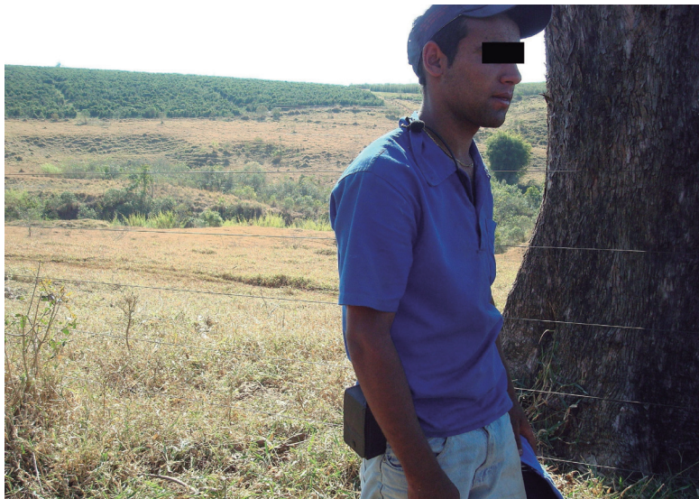
FIGURA 1 - Local onde foi posicionado o microfone no operador.