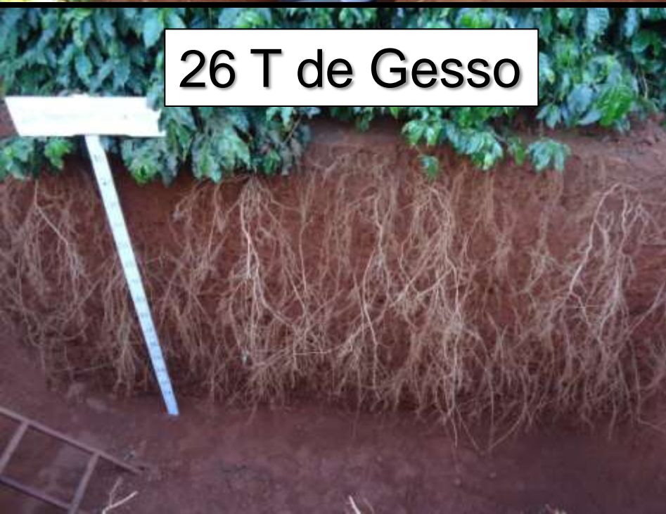
26 T de Gesso