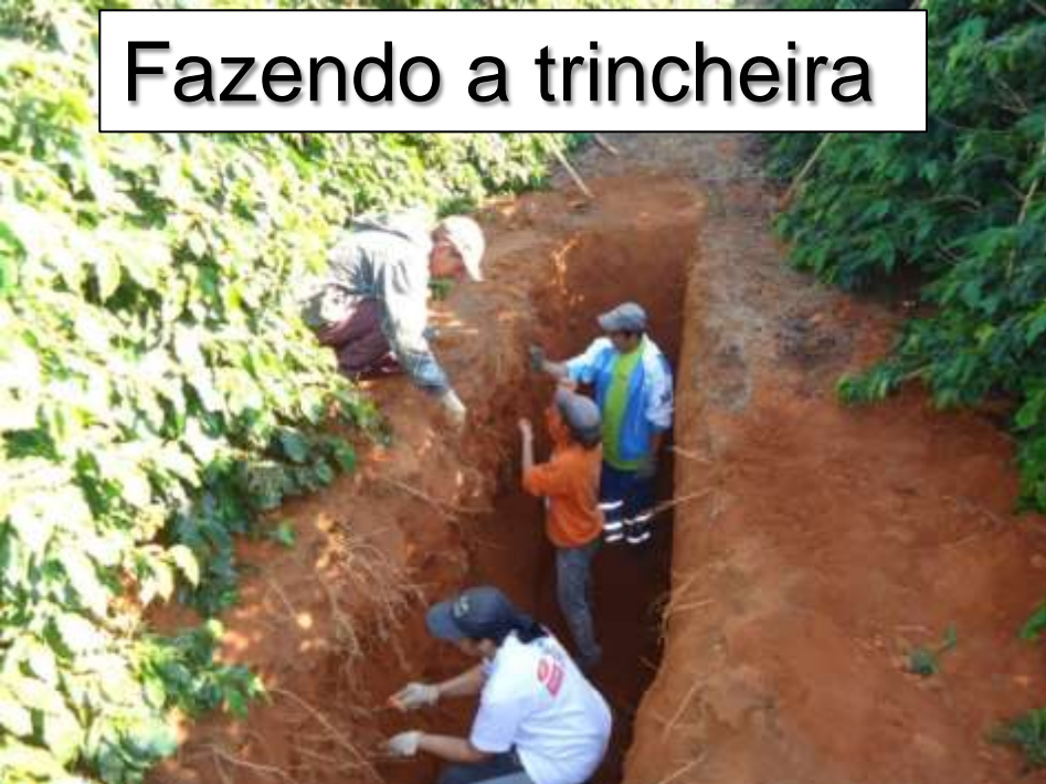
Fazendo a trincheira