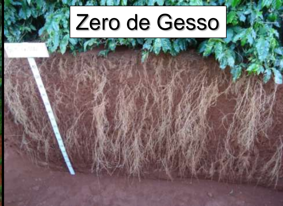
Zero de Gesso