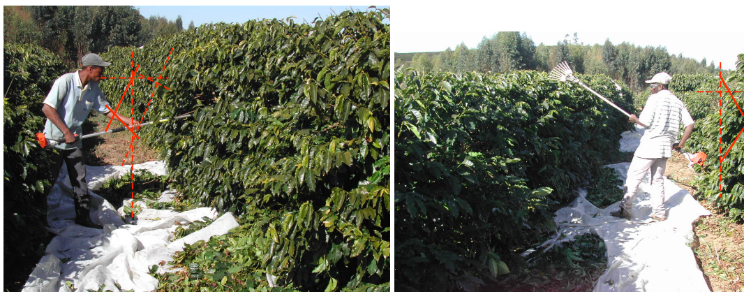
Figura 1. Ângulos formados pelo sistema articular cotovelo durante o acionamento de uma derriçadora mecânica portátil de café.

ombro e cotovelo durante seu acionamento foram determinados a partir da análise das imagens geradas em programa computacional AutoCad.