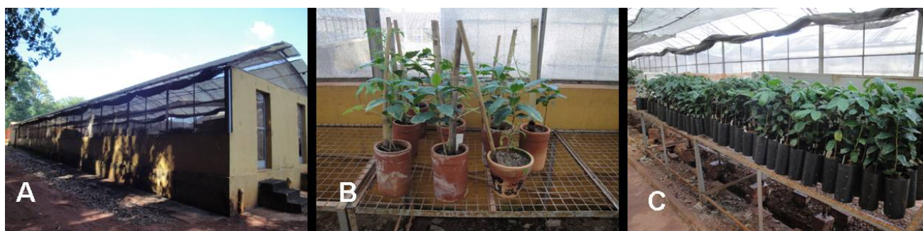
Figura 1. Experimento montado para avaliação de resistência ao nematoide M. paranaensis . A) Casa de Vegetação; B) População de M. paranaensis (IAC 36 isolado de Cássia dos Coqueiros) conduzida em tomateiros e em cv. Mundo Novo; C) Materiais transplantados e mantidos em casa de vegetação para condução do experimento.

O experimento foi instalado com 17 tratamentos, 12 repetições, sendo arranjado de maneira inteiramente casualizado (figura 1C), utilizando o tratamento 15 (Cultivar Mundo Novo) como controle para comparação. Foi mantida uma população de M. paranaensis IAC 36 (isolado de Cássia dos Coqueiros) em mudas de café cv. Mundo Novo e tomateiro, até o aumento populacional necessário para produção do inóculo (figura 1B).