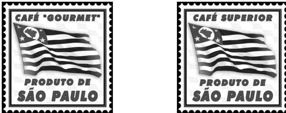
FIGURA 1 – Selo do Sistema de Qualidade de Produtos Agrícolas, Pecuários e Agroindustriais do Estado de São Paulo para café Gourmet e Superior

Em 2002, o selo já estampava o produto de cinco torrefações paulistas, sendo que esse número de empresas aderentes não exibiu grande oscilação desde então.