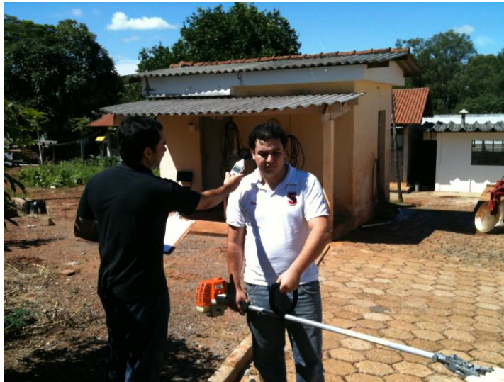
Figura 5 Avaliação da pressão sonora.

A avaliação da pressão sonora foi realizada por meio de um decibelímetro digital da marca Minipa, modelo MSL-1325, com resolução de 0,1 dB. A caracterização foi utilizada à velocidade máxima da derrçadora manual, com cinco repetições. Foi caracterizado também o nível de pressão sonora natural do ambiente.