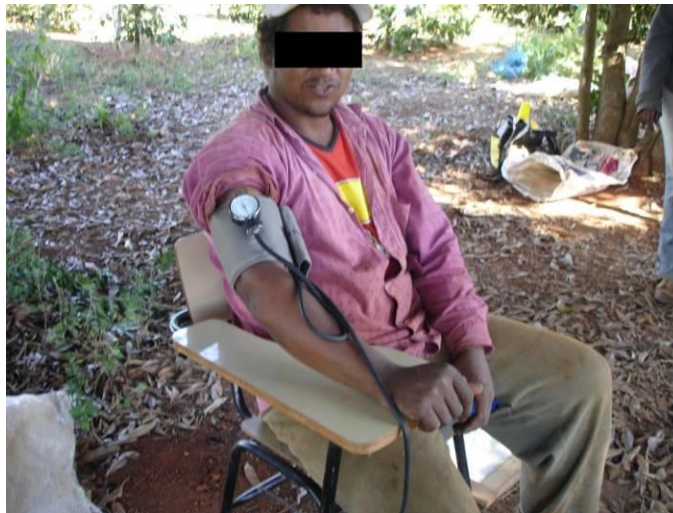
Figura 3 Posicionamento do trabalhador para aferição da pressão arterial.

A aferição da pressão arterial de repouso foi realizada por meio de um esfigmomanômetro do tipo aneróide, devidamente calibrado e um estetoscópio, tendo o trabalhador se mantido sentado em uma cadeira com apoio de braço (Figura 3).