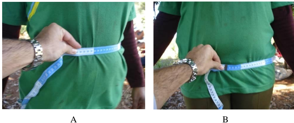
Figura 2 Coleta de dados para o cálculo da RCQ, sendo a) obtenção da medida da cintura (cm) e b) obtenção da medida do quadril.

Na cintura foi medida, com uma fita métrica inelástica, no ponto médio entre a crista ilíaca e a face externa da última costela. No quadril, a fita foi posicionada na região trocantérica no nível dos quadris e nádegas (Figura 2), cuidando para que a fita ficasse bem posicionada, alinhada horizontalmente e sem dobras.