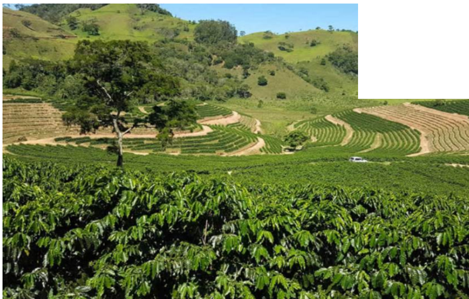
A cafeicultura do Estado está concentrada na região Noroeste, com 80% da produção.