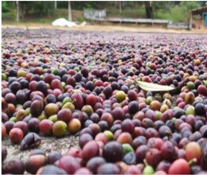
Objetivo é garantir a qualidade da produção de cafés especiais em todo o Estado.

“A Coordenadoria tem levado aos produtores técnicas de manejo para a garantia da qualidade do produtor e o consumidor”, afirma o coordenador de controle de agrotóxicos, Leonal. A cultura do café tem grande importância econômica e social.