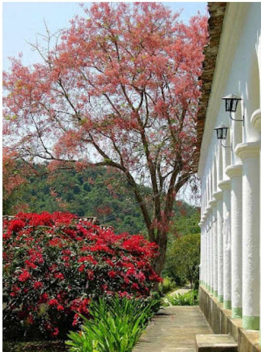
Detalhe das colunas da casa sede do Sítio São Luis.