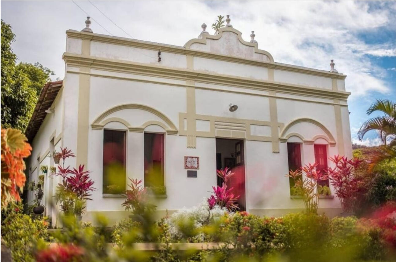
Sítio São Roque é membro da Rota do Café, e produz café sombreado de forma agroecológica.

Além do café, a economia local está assentada no setor de serviços, por meio do turismo e na produção de gêneros agrícolas tradicionais, como algodão, banana, arroz, cana-de-açúcar, além da pecuária em menor escala: bovinos, suínos e avícolas.