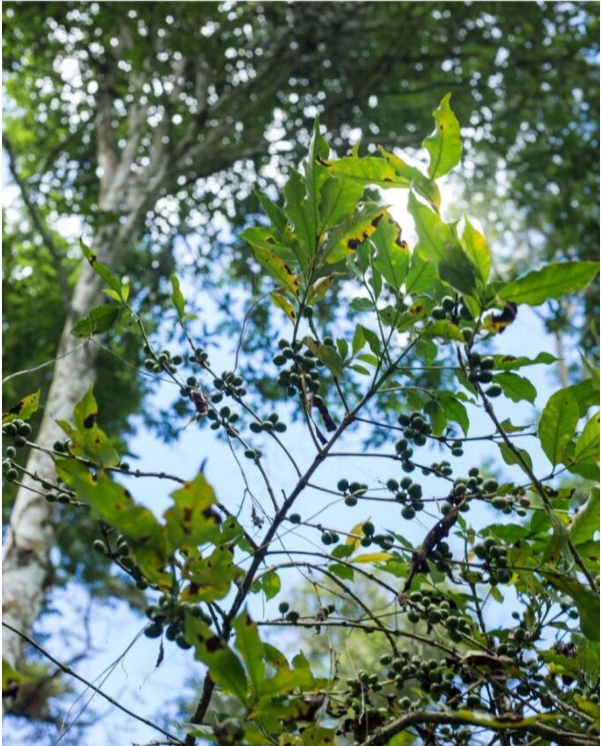
Café produzido à sombra de árvores nativas da Mata Atlântica.

Na produção do café de sombra, os pés da planta são cultivados embaixo de outras árvores frondosas, como as ingazeiras, que protegem o café e fazem com que o sabor da bebida fique ainda mais gostoso.