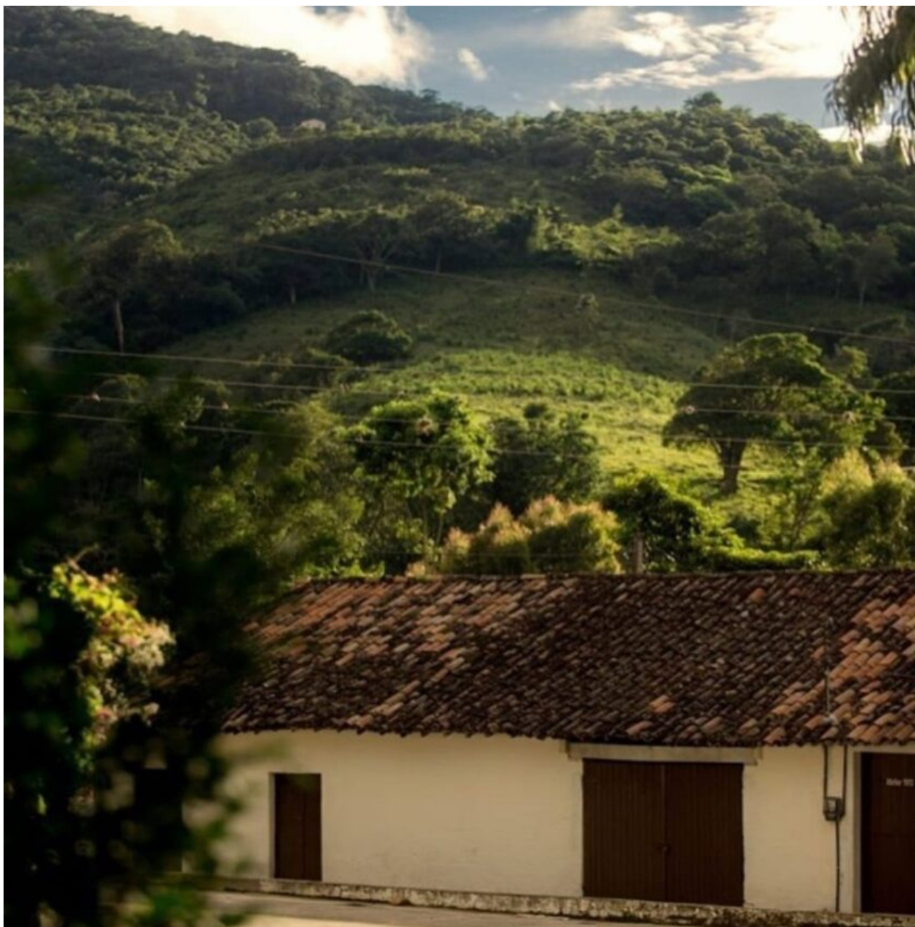
Outras instalações do Sítio São Roque...

Referência no cultivo do café arábica sombreado, propicia a seus visitantes o contato direto com todo o processo de beneficiamento do grão, desde o plantio até a torragem e degustação.