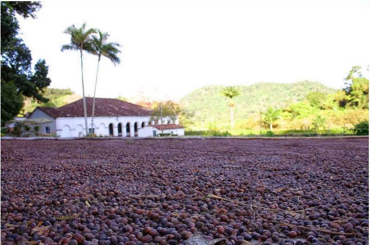
Sítio São Luis é um dos destaques da Rota Verde do Café. A propriedade, uma das pioneiras na produção do grão, carrega a história da região.