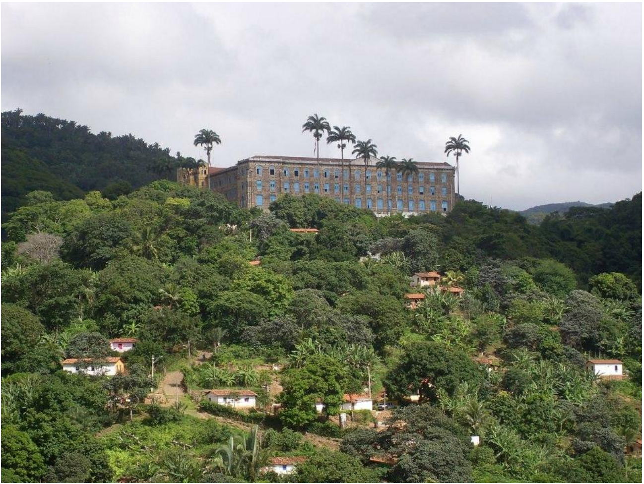
Mosteiro dos Jesuítas combina história, religiosidade e preservação ambiental acompanhado de café local.

O imponente complexo arquitetônico originado em 1927, conhecido como Mosteiro, abriga o antigo Seminário Menor do Coração de Jesus e a fazenda Caridade.