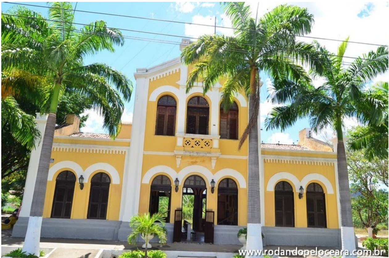
Estação Ferroviária de Baturité representa o auge do café na região.

Inaugurada em 1882, no Reinado de D. Pedro II, a Estação Ferroviária de Baturité representa a importância econômica da região por onde a produção agrícola, principalmente café, tinha seu destino garantido à capital Fortaleza.