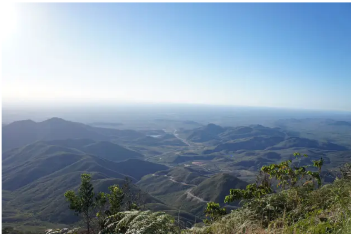
Do Pico Alto se vê o Maciço de Baturité, localizado no sertão do Ceará, coberto pela Mata Atlântica espalhada por 32 mil hectares.

Os prédios históricos e seu valor histórico são outra característica do município. A Pousada dos Capuchinhos, antes um mosteiro, é um dos principais pontos turísticos da cidade, mesmo para aqueles que não estejam lá hospedados. A beleza do antigo mosteiro se estende, ainda, por seus jardins repletos de roseiras e plantas nativas e pela capela.