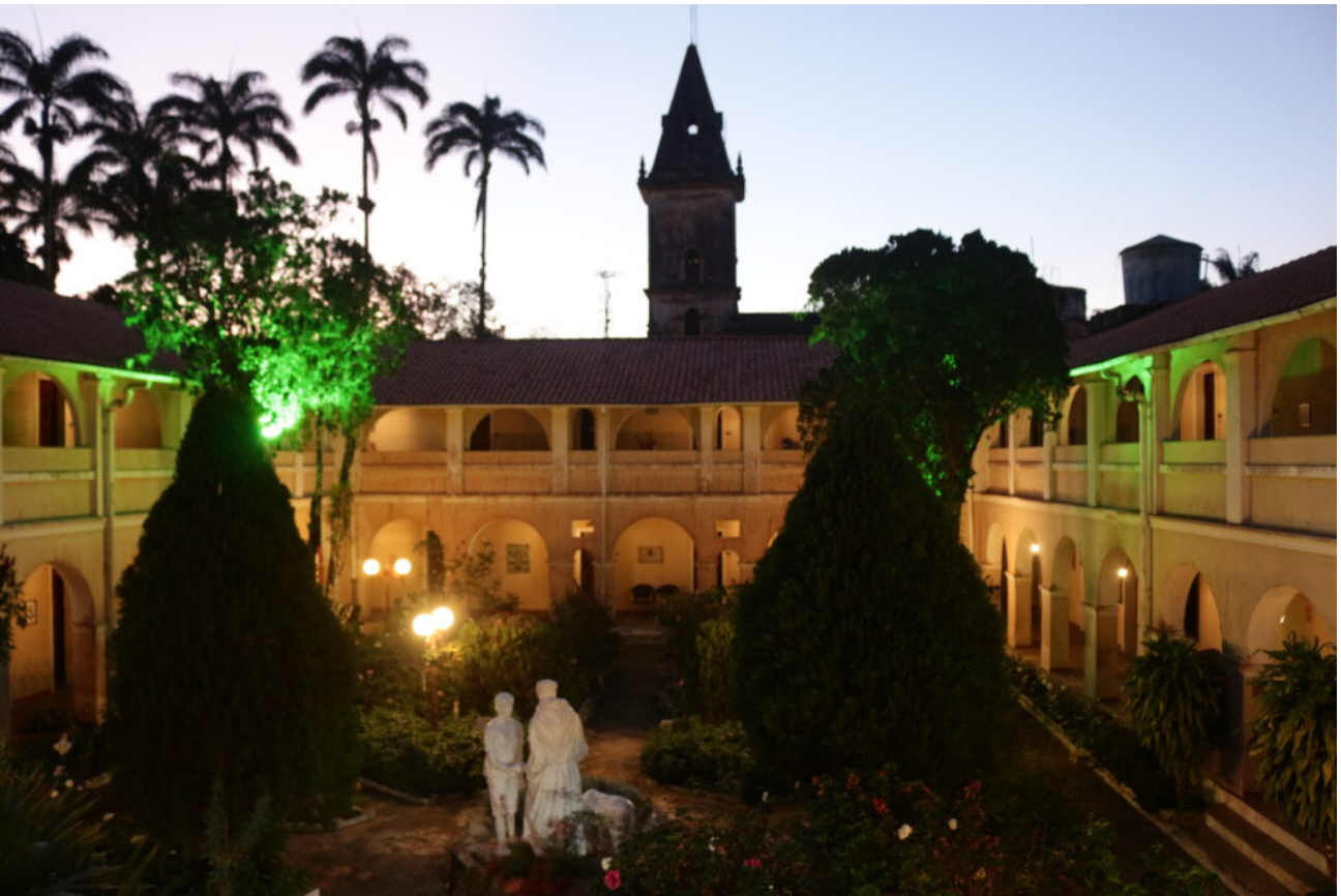
A Pousada dos Capuchinhos, antes um mosteiro, é um dos principais pontos turísticos da cidade de Guaramiranga, e conta até mesmo com uma capela (Foto acima).

A maioria dos sítios foi assim formada a partir desses pequenos “roçados de café”, e muitos proprietários de terra adquiriram plantações extras de café numa escritura à parte.