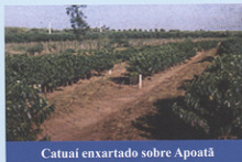
Catuai enxertado sobre Apoaatã

Ouro Bronze IAC 4925 - Corresponde ao cruzamento entre Catuai Amarelo e Mundo Novo, foi selecionada e liberada pelo IAC a partir de 2007. Tem em sua formação 62,5% de Bourbon e 37,5% de Tipica. As folhas novas têm coloração bronzeada. É indicada para espaçamento largo e adensado e altitudes baixas e média, adapta-se bem à cafeicultura irrigada, regiões quentes e solos de baixa fertilidade. Apresenta elevada adaptabilidade a diferentes regiões e condições de cultivo.